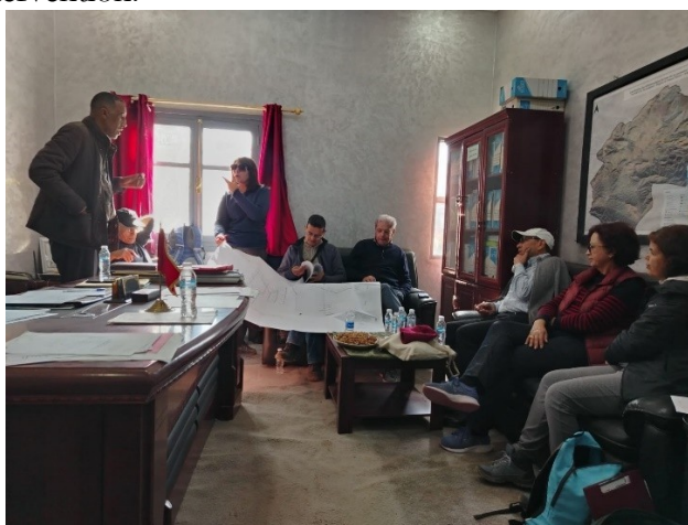
Réunion avec le président de la commune d'Ouneine

Suite à ces deux missions, un groupe de six douars (Manab, Tiguaniwe, Dou-Souk, Toug El Kheir, Tagadirt n'Tafoukt, et Tagadirt n'Aït Nacer) formant l'ensemble de la fraction d'Adouz a été identifié comme zone d'intervention.