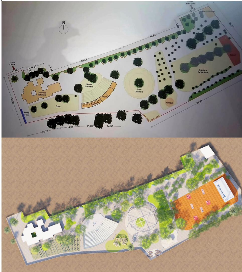
Réalisé par l'Architecte Hanae Bekkari (équipe Targa)

L'équipe de Targa-Aide, en collaboration avec ses experts et architectes, a déjà élaboré un plan architectural issu d'une approche participative menée avec les communautés concernée (voir plan ci-dessous).