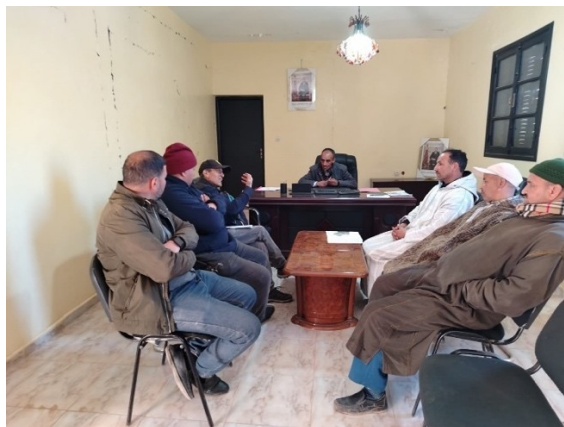
Réunion avec le président de la commune Ijoukak et certains membres du conseil communal