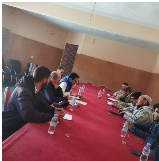
Réunion avec le président de la commune Tizi n'Test et certains membres du conseil