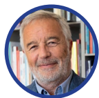
François Rebsamen Président de Cités Unies France Maire de Dijon Président de Dijon Métropole

J'espère vous retrouver nombreuses et nombreux en présentiel à cette 13 e édition ; et je souhaite que cet événement soit tout autant un espace d'information, d'échanges, de réflexions croisées, de débats, de partage d'expérience, entre collectivités françaises, mais aussi avec nos partenaires étrangers.