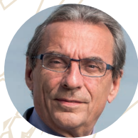
Roland Ries, Presidente de Cités Unies France